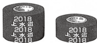
水道管用（年号入り）