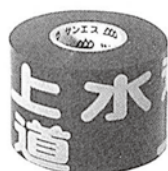
水道管用（年号なし）