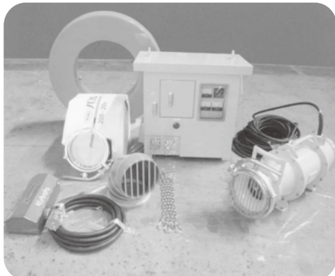
注) 動力用発動発電機（45kVA）が含まれておりませんので別途リースでご用意願います。

1台で5m 3 /min（全揚程10mにおいて）の排水能力を有しながら、全て人力で設営可能なユニットです。局地的豪雨等による浸水被害時にも迅速な排水活動が可能になります。