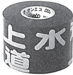
水道管用（年号なし）