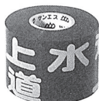
水道管用（年号なし）