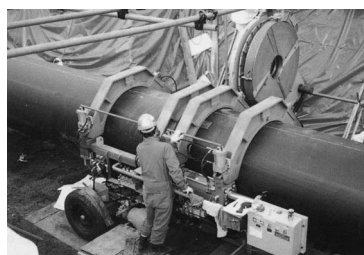
融着状況現場写真