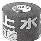
水道管用（年号なし）