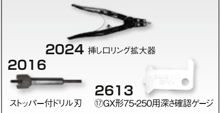
2024 挿しリング拡大器