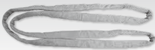
①GX形300~450用ラウンドスリングL=1700