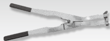
⑨GX形300~450用ロックリング拡大器 (異形管接合用)