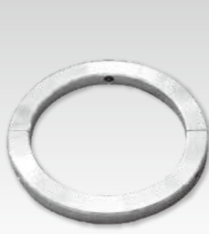
ガイドリング(口径別)