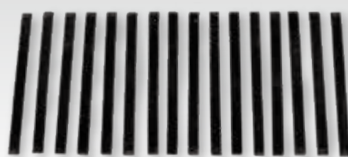
⑭中口径異形管用解体矢