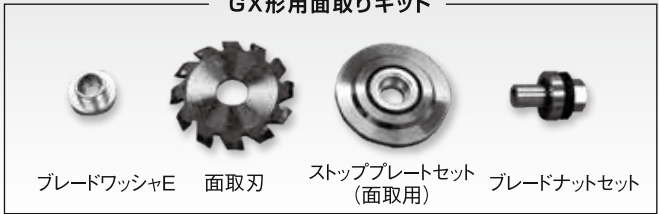
ブレードワッシャE 面取刃