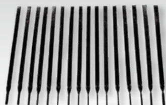
⑬中口径直管用解体矢