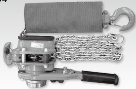
②GX形75~250用チェーンレバーホイスト800Kg (直管・P-Link接合用)