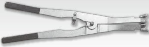
⑧GX形75-250ロックリング拡大器 (異形管接合用)