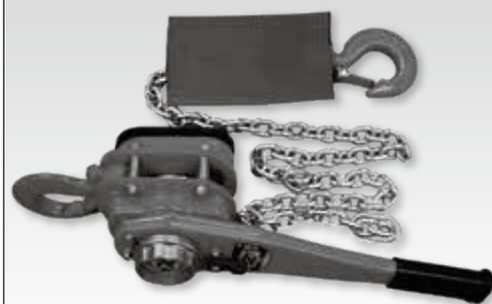
②GX形300~450用チェーンレバーホイス2トン