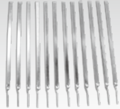
④小口径直管用解体矢