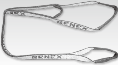
①GX形75~250用スリングベルト (直管・P-Link接合用)