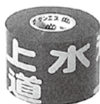
水道管用（年号なし）